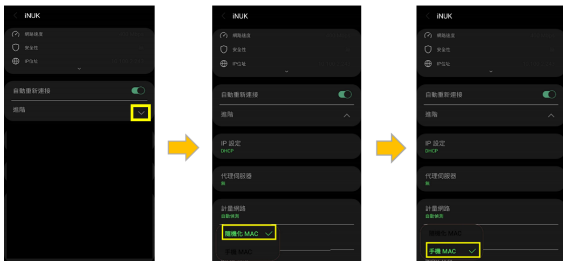
圖 2 MAC 設定