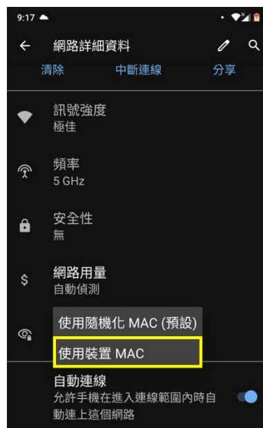
圖 4 MAC 設定