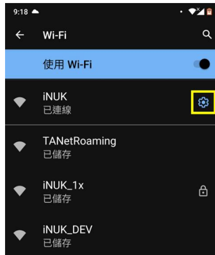
圖 3 設定