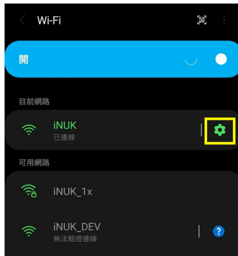
圖 1 設定